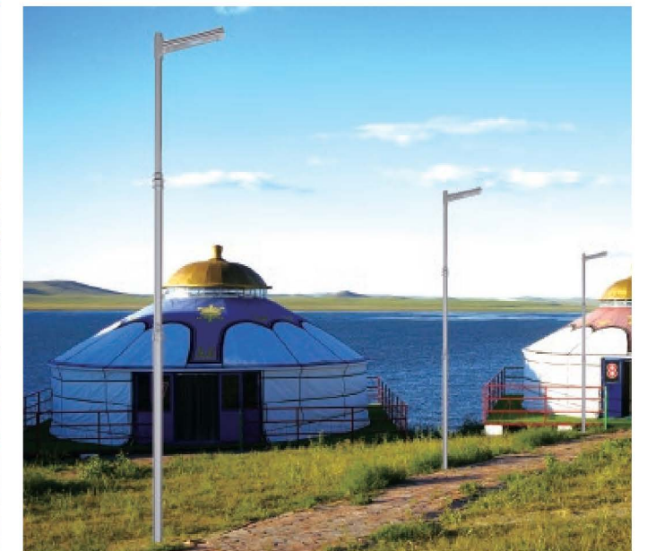
型号: LDTYN-09802 型 高度: 5-8m 光源: LED

地址: 扬州市北郊高邮菱塘镇工业园区 (邮天路与新扬菱路交界处) 传真: 0514-84238418 http://www.bswjt.com (照明网址)