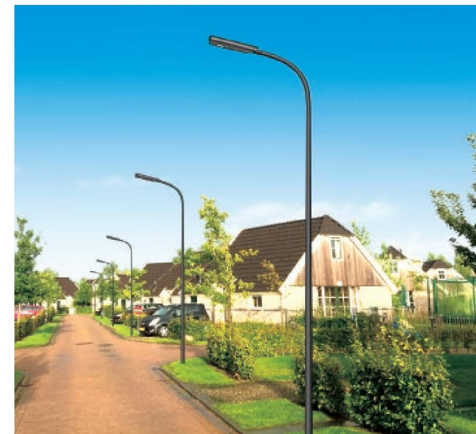
型号: LDTYN-09801 型 高度: 5-8m 光源: LED